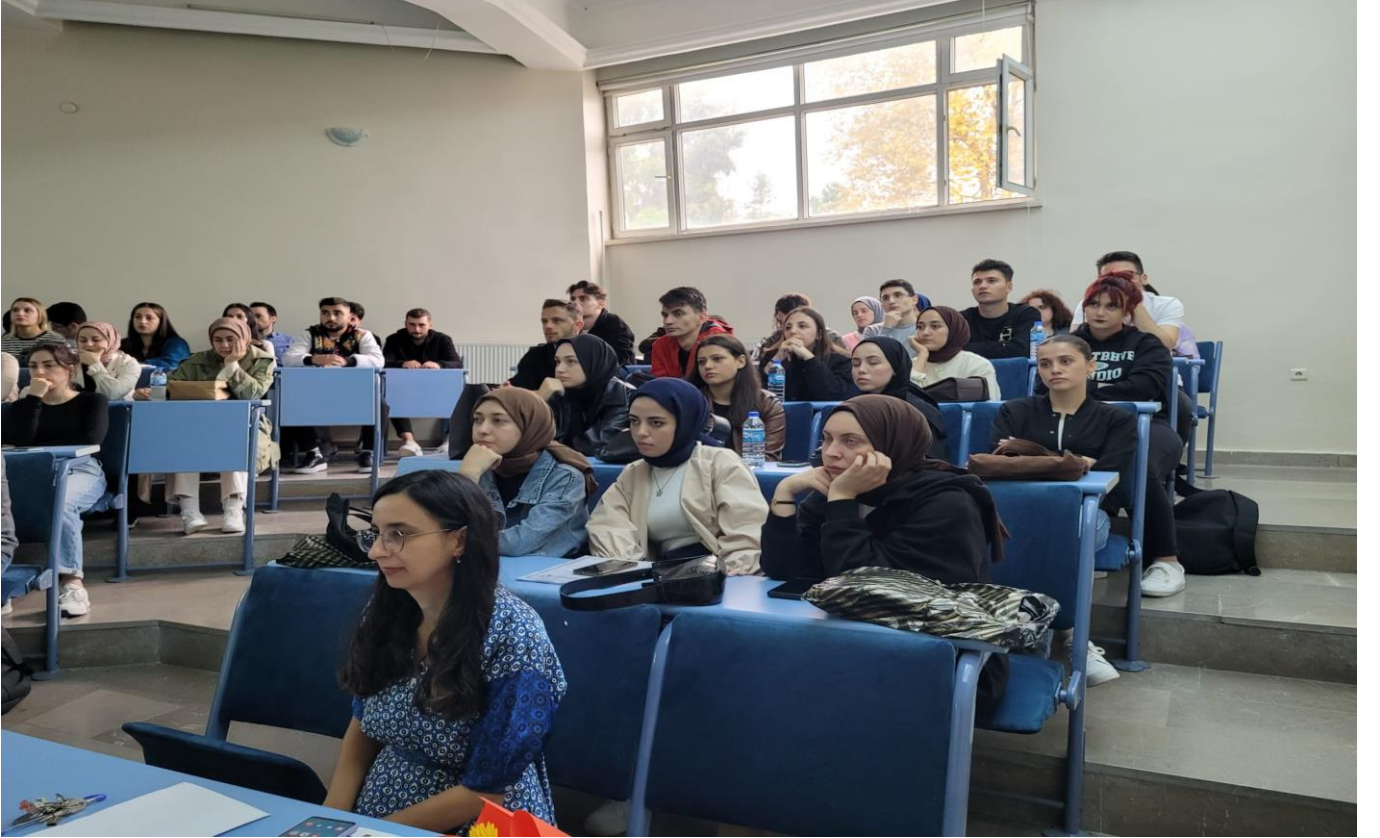
• Görsel 6. Türkçenin Son Bin Yıllık Serüveni: Dilin Vatanı Olur Mu? Konferansı