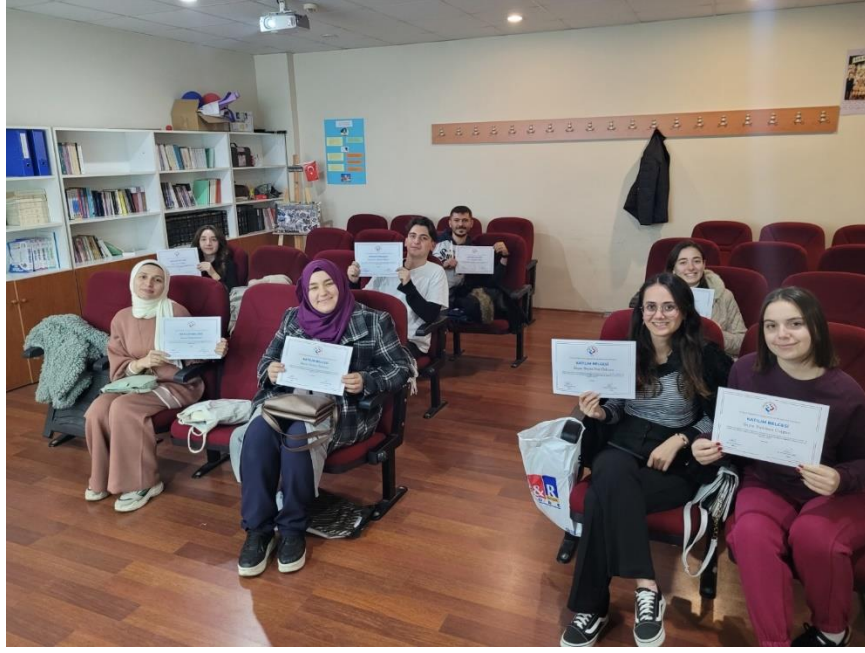
Görsel 9. Lisans Öğrencilerine Yönelik Temel Hızlı ve Anlamli Okuma Eğitimi (1. Grup)