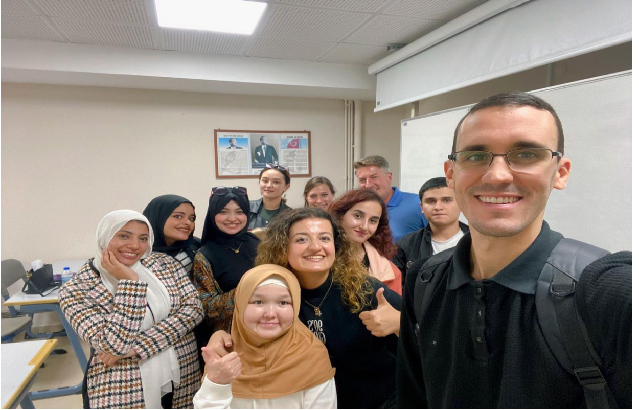
Görsel 3. Türkçe Kursu (A1 Sınıfı)