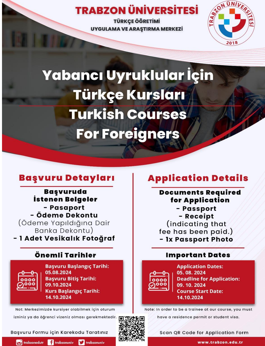
Görsel 1. Türkçe Kursu Afışı

Brezilya, Gürcistan gibi farklı ülkelerden öğrenciler de bulunmaktadır. YTB ile merkezimizde Türkçe öğrenen toplam 12 öğrencinin 9 tanesi lisansüstü eğitim almakta, 3 tanesi ise lisans eğitimi almaktadır. Diğer kursiyer öğrencilerimiz ise Trabzon'da yerleşik bulunan yabancı vatandaşlardan oluşmaktadır.