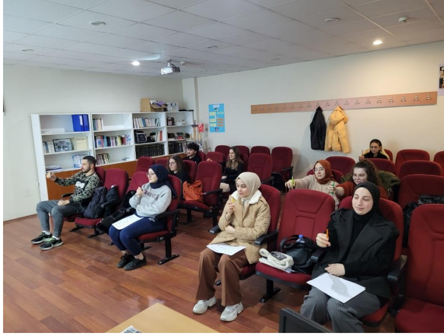
Görsel 10. Lisans Öğrencilerine Yönelik Temel Hızlı ve Anlamli Okuma Eğitimi (2. Grup)