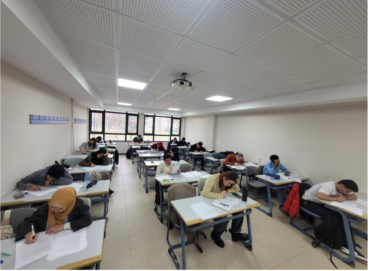
Görsel 2. Türkçe Kursu (A1 Sınıfı)