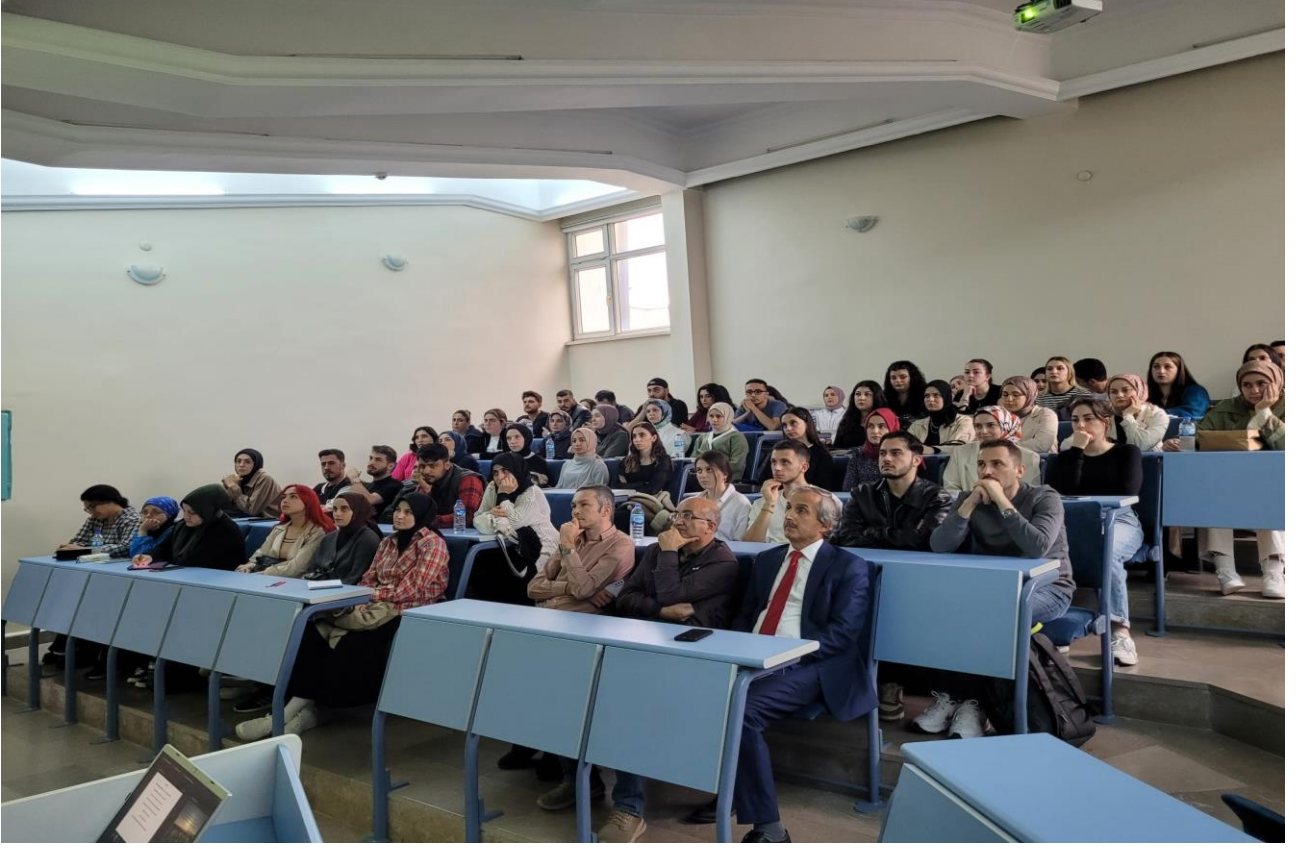
• Görsel 5. Türkçenin Son Bin Yıllık Serüveni: Dilin Vatanı Olur Mu? Konferansı